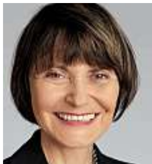
Micheline Calmy-Rey, Bundesrätin, Vorsteherin des Eidgenössischen Departements für auswärtige Angelegenheiten

Im Namen der drei für den freien Personenverkehr zuständigen Departemente: