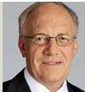
Johann N. Schneider-Ammann, Bundesrat, Vorsteher des Eidgenössischen Volkswirtschafts- departements