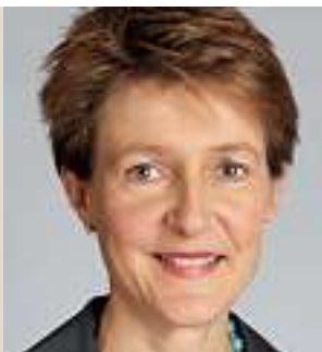
Simonetta Sommaruga, Bundesrätin, Vorsteherin des Eidgenössischen Justiz- und Polizeidepartements